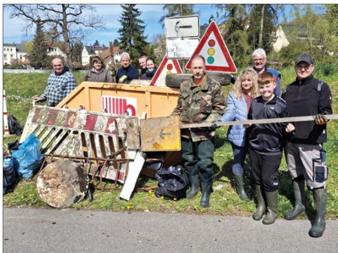
Der Angelsportverein Flöha hat bei seiner Gewässerreinigung wieder viel Müll aus den Flüssen geholt.