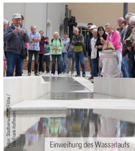
Einweihung des Wasserlaufs

Rund 250 Besucher sahen, was Städtebauförderung konkret bewirken kann. Denn ohne die Förderung von Bund und Freistaat, betont auch Oberbürgermeister Volker Holuscha, wäre die Alte Baumwolle eine Industriebrache geblieben. Vielleicht lag genau darin die eigentliche Botschaft dieses Tages: Stadtentwicklung ist ein Prozess, der immer dort entsteht, wo angepackt wird.