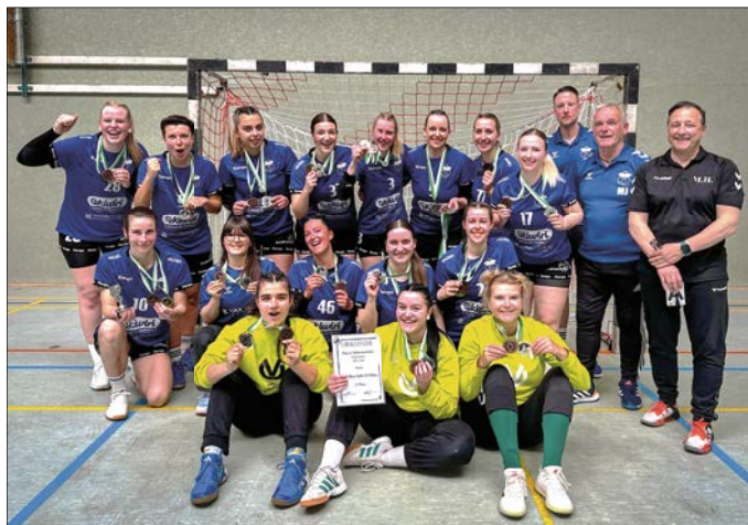
Die Handballerinnen des VfB Flöha haben eine starke Leistung abgeliefert.

Die Mannschaft wird auch in der kommenden Saison in der Regionsoberliga an den Start gehen. „Der Kader bleibt zusammen, wir bekommen sogar noch Verstärkung. Somit sind wir in Zukunft noch breiter aufgestellt und verfügen über zusätzliche spielerische Optionen“, sagt Butze. kbe