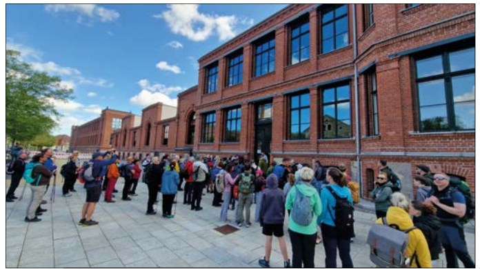
Sammelpunkt und Start vor dem Rathaus