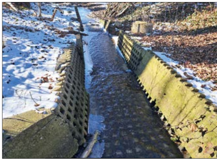
Ein mit Rasengittersteinen verbautes Gewässer. Die Platten sind instabil und im Hintergrund kann man sehen, wie sie bereits ins Gewässer fallen. Zurück bleibt ein ungeschütztes Ufer.

Wenn Rasengittersteine also aus dem Bach vor der Haustür oder in freier Landschaft entfernt werden, dann aus Gründen des Hochwasserschutzes, der Ökologie und als Beitrag zur Stabilisierung des Wasserhaushalts in Trockenphasen. Die Platten können nach dem Entfernen oft sogar noch wiederverwendet werden – etwa als Fundament für einen Komposthaufen, wo sie wieder ihrem ursprünglichen Zweck dienen können.