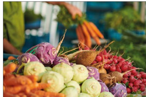
Frisches Gemüse auf einem Wochenmarkt.

Deutsche Marktgilde eG Niederlassung Dresden Breitscheidstraße 84 01237 Dresden Tel.: 02774 9143-200 E-Mail: dresden@marktgilde.de www.treffpunkt-wochenmarkt.de