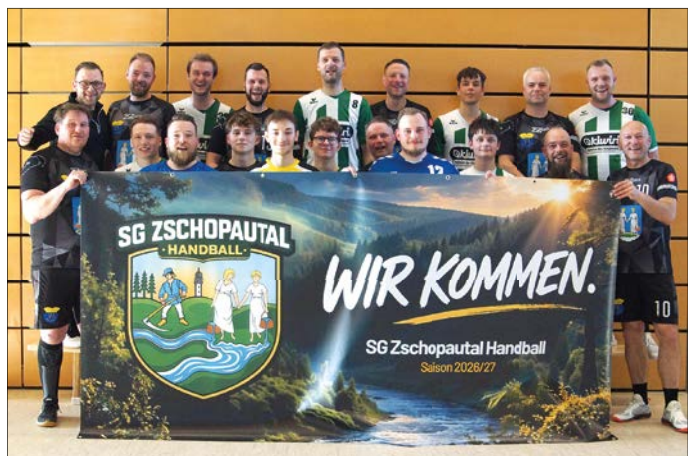
Besiegelt: Die Männerteams aus Flöha und Niederwiesa gehen in der kommenden Saison als SG Zschopautal an den Start.

Mit dem Begriff einer Sensation sollte man sicherlich vorsichtig umgehen. Äußerst bemerkenswert ist der Vorgang aber allemal. Die Handball- Männerabteilungen des VfB Flöha und des SV Niederwiesa gehen ab der kommenden Saison als SG Zschopautal gemeinsam als eine Einheit auf Punktejagd. Vor einigen Jahren schien dieser Schritt undenkbar. Schließlich standen sich beide Vereine sehr lange als sportliche Konkurrenten gegenüber, die sich in den direkten Duellen nichts schenkten und die Spieler sich früher nicht unbedingt regelmäßig zum gemütlichen Bier trafen. Im April 2026 waren beide Mannschaften in der Regionsklasse noch einmal Gegner. Flöha gewann 48:39.