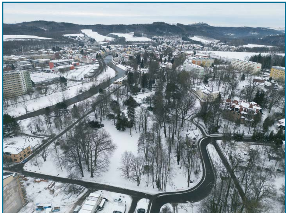
Der Baumwollpark im Januar 2025.

Die Ausschreibung für die Bauleistungen erfolgte Ende 2025. Den Auftrag erhält die Firma Fachcenter Garten + STL-Bau GmbH aus Hauptmannsgrün. Die Bau-summe beläuft sich auf rund 608.000 Euro. Finanziert wird das Projekt im Rahmen des gebietsbezogenen integrierten EFRE-Handlungskonzeptes der Stadt Flöha. Als Bestandteil dieses Programms wird die Aufwertung des Baumwollparks zu 75 Prozent aus Mitteln des Europäischen Fonds für regionale Entwicklung (EFRE) gefördert.