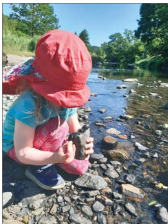
Bei einem genauen Blick ins Gewässer, kann man Vieles entdecken.

Der Biber ist inzwischen wohl vielen bekannt, aber auch Fischotter, Graureiher, Eisvogel, Bachstelze und Wasseramsel gehören zu den größeren Lebewesen am und im Wasser. Doch es gibt auch viele kleinere Tiere, die nicht sofort ins Auge fallen. Libellen legen ihre Eier an Wasserpflanzen, Totholz oder direkt im Wasser ab. Die Larven, die sich daraus entwickeln, leben bis zu ihrer Verwandlung in eine erwachsene Libelle im Wasser. Ebenso verbringen Köcherfliegen, Steinfliegen oder Eintagsfliegen einen großen Teil ihres Lebens als Larven im Wasser. Weitere wirbellose Tiere sind Wasserwanzen, Strudelwürmer, Käfer, Schnecken, Muscheln und Bachflohkrebse.