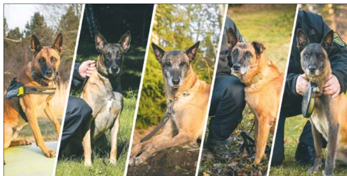
Fünf Diensthunde in den Ruhestand verabschiedet.

Als Familienhunde bleiben die Vierbeiner nun bei ihren Hundeführern, denen sie stets ein verlässlicher Partner waren und sind. Vier der fünf Diensthundeführer haben bereits neue Hunde als Welpen übernommen. Dabei handelt es sich um zwei Deutsche Schäferhunde und zwei Malinois, die nun in die Fußstapfen bzw. „Pfotenabdrücke“ ihrer Vorgänger treten. (ds)