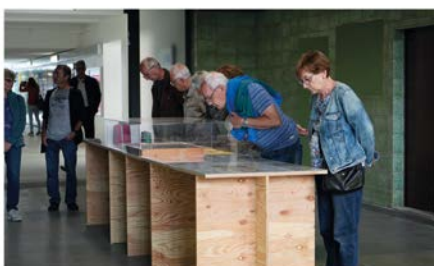
Kunstbahnhof, Foto: Stadtverwaltung Flöha