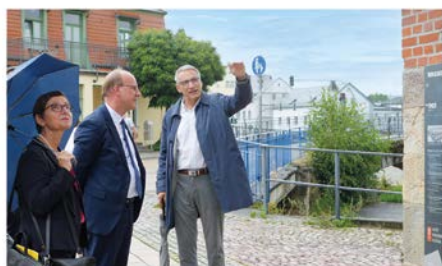
Delegation (SMIL)