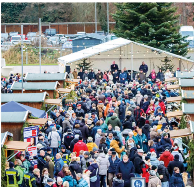
Eröffnung des Marktplatzes

Und einen Preis gab es auch: Beim Wettbewerb „Ab in die Mitte! Die City-Offensive Sachsen“ erhielt Flöha den Sonderpreis „Digitalisierung“ (3.000 Euro) für die „Flöhaer Bankgeschichten“. Die Idee: QR-Codes an Bänken im neuen Zentrum sollen auf dem Smartphone Stadtgeschichte lebendig machen – virtuell und durch die Nutzer dann auch ganz real.