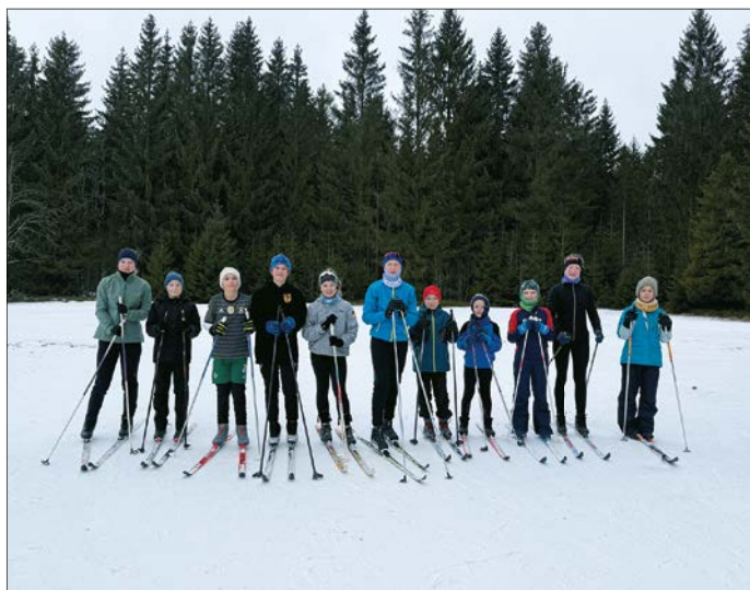
Skilager Johanngeorgenstadt 2025 bei besten Bedingungen.