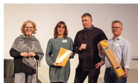
Preisverleihung „Ab in die Mitte“

Der Weg bis zur offiziellen Eröffnung des Marktplatzes lief 2025 in Etappen. Am 1. Oktober wurde das erste große Teilstück freigegeben; im Dezember folgte die Einweihung als Gemeinschaftsleistung. Holuscha: „Wir haben das keiner externen Eventagentur übertragen. Unsere Mitarbeiter, mit Unterstützung von Vereinen, Geschäften, Kirche, haben das alles selbst gestaltet.“ Sein Fazit: „Es ist ja unser aller Marktplatz.“