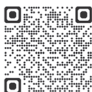
Flöha – Vortrag zur Stadtgeschichte Teil 3: Flöha – Alte Ansichten – neue Bilder