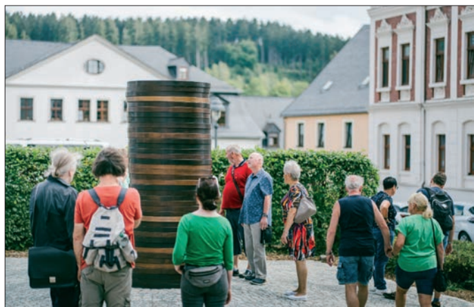
Sean Scully, Coin Stack 2; Courtesy Sean Scully

Der 1945 in Dublin geborene Bildhauer Sean Scully, Enkel eines Bergmanns, wuchs in einem Arbeiterviertel in Süd-London auf.