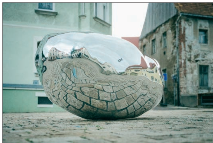
Wilhelm Mundt, Trashstone 689

Am 6. Juli 2024 wurde in Freiberg die Skulptur „Trashstone 689“ von Wilhelm Mundt offiziell eingeweiht. Der 1959 in Grevenbroich geborene, in Rommerskirchen arbeitende und an der Dresdener Hochschule für Bildende Künste lehrende Bildhauer Wilhelm Mundt hat eine seiner ikonischen Skulpturen aus der Serie Trashstone in der Silberstadt platziert. Die elegant spiegelnde Aluminiumoberfläche der Skulptur umschließt eine hermetische Innenwelt, die nach Angaben des Künstlers aus Produktionsrückständen des Ateliers besteht, den Betrachtenden jedoch verborgen bleibt.