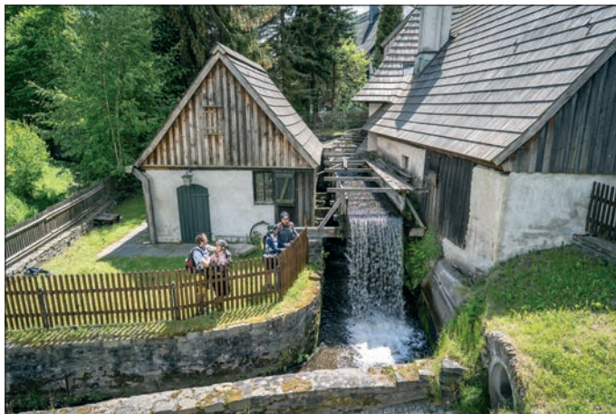
Frohauer Hammer in Annaberg Buchholz.

Weitere Informationen zu den fünf Regionen und ihren Angeboten unter: www.ergebirge-tourismus.de/erlebniswelterbe