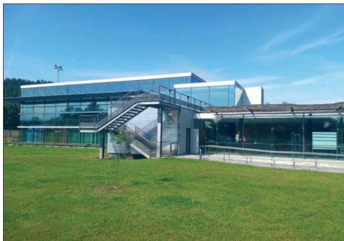
Die Handballer des VfB Flöha tragen ihre Heimspiele in der Sporthalle des Samuel-von-Pufendorf-Gymnasiums aus.

SG HSC Chemnitz (31. August) an. Das nächste Heimspiel steht am 8. September, 16 Uhr gegen den TSV Einheit Claußnitz auf dem Programm. Die Frauen des VfB Flöha starten am 31. August in der Regionsoberliga mit dem Heimspiel gegen den Burgstädter HC (Anwurf 17 Uhr) in die Punktspielserie. kbe