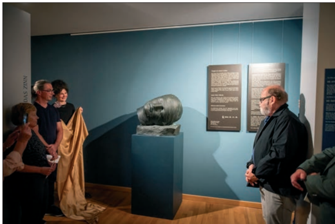
Igor Mitoraj, Testa Addormentata

Im Rahmen des begleitenden Programms am PURPLE PATH wurde am 5. Juli 2024 die Skulptur „Testa Addormentata“ von Igor Mitoraj im Museum DIE WEBEREI enthüllt. Der Bildhauer Igor Mitoraj (1944–2014) hat eine besondere Beziehung zu Oederan. Anhand der Skulptur „Testa Addormentata“, einer Leihgabe der Sammlung Wemhöner, wird seine Geschichte erzählt. Gleichzeitig wurde zur Einweihung ein Grafikprojekt für Jugendliche vorgestellt, das Mitorajs Leben in Bildern darstellt. Interessenten können zudem an einer Graphic Novel mitzeichnen.