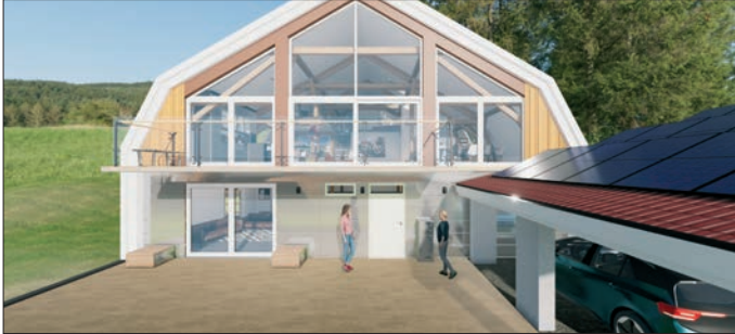
Blick auf das Mittelsächsische Haus

Wie regional man ein Haus bauen und einrichten kann, zeigt die Nestbau-Zentrale mit dem digitalen Projektmodell „Mittelsächsisches Haus“. Nun wurde es mit weiteren Unternehmen ergänzt.