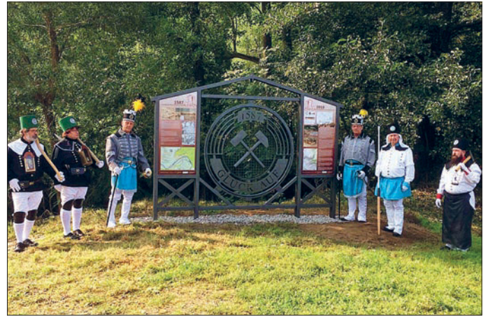
Das neu eingeweihte Ensemble der Falkenauer Schmelzhütte an der schwarzen Brücke ist eine weitere Station im Bergbaurundwanderweg Falkenau. Die Abordnungen „Blaufarbenwerk Waldkirchen / Zschopenthal“ und „Reicher Segen Gottes zu Sachsenburg“ eskortierten beidseitig der Infotafel.

Das errichtete Ensemble hat eine Größe von 3,14 m x 2,49 m und in der Mitte ziert das Bergbausymbol Schlegel und Eisen. Dieses Stahlgerüst entstand in der Werkstatt der Schlosserei Leisner GmbH Flöha/Falkenau. Die Gestaltung der beidseitigen Infotafeln realisierte die Werbeagentur „Made in Flöha“ und die Tiefbauarbeiten des Gerüsts sicherte Bauhandwerk Dirk Herbrich ab. Das ganze Projekt entstand auf Initiative des Heimatvereins Falkenau e.V. in Kooperation mit dem Landesarchäo-