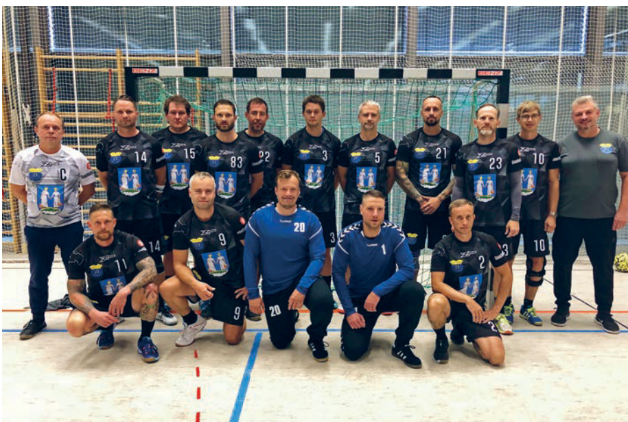
Die Handball - Männermannschaft des VfB Flöha in der Saison 2019/20.