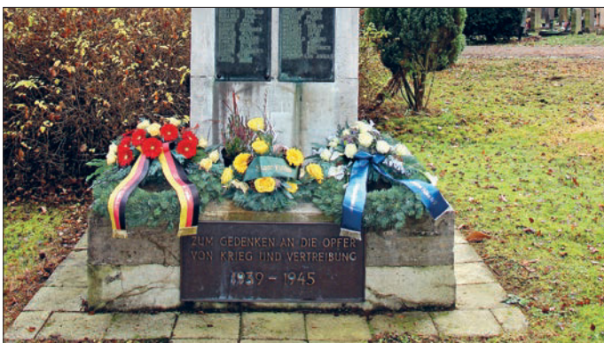
Blumengebinde zum Volkstrauertag am 15. November 2020 an der Gedenkstätte für die Opfer von Krieg und Vertreibung auf dem Waldfriedhof in Flöha-Plaue.

Eine erhoffte Entspannung bei den Fallzahlen ist auch tendenziell momentan nicht festzustellen. Bis zum Veranstaltungstermin hatten zahlreiche Bürgerinnen und Bürger ihre Teilnahme zu dieser Veranstaltung zugesagt. Eine verantwortungsvolle Einhaltung der gegenwärtigen Hygieneregeln ist dadurch nur schwer möglich. Oberbürgermeister Holuscha legte am 15. November, 10.00 Uhr im stillen Gedenken ein Blumengebinde an der Gedenkstätte für die Opfer von Krieg und Vertreibung auf dem Waldfriedhof in Flöha-Plaue nieder. Auch Parteien würdigten diesen Tag mit eigenen Veranstaltungen und Blumengebinden an der Gedenkstätte.