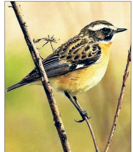
Zu den bedrohten Arten gehört auch das Braunkehlchen.

Weiterführende Informationen können auch im Bereich Projekte im Internetauf-