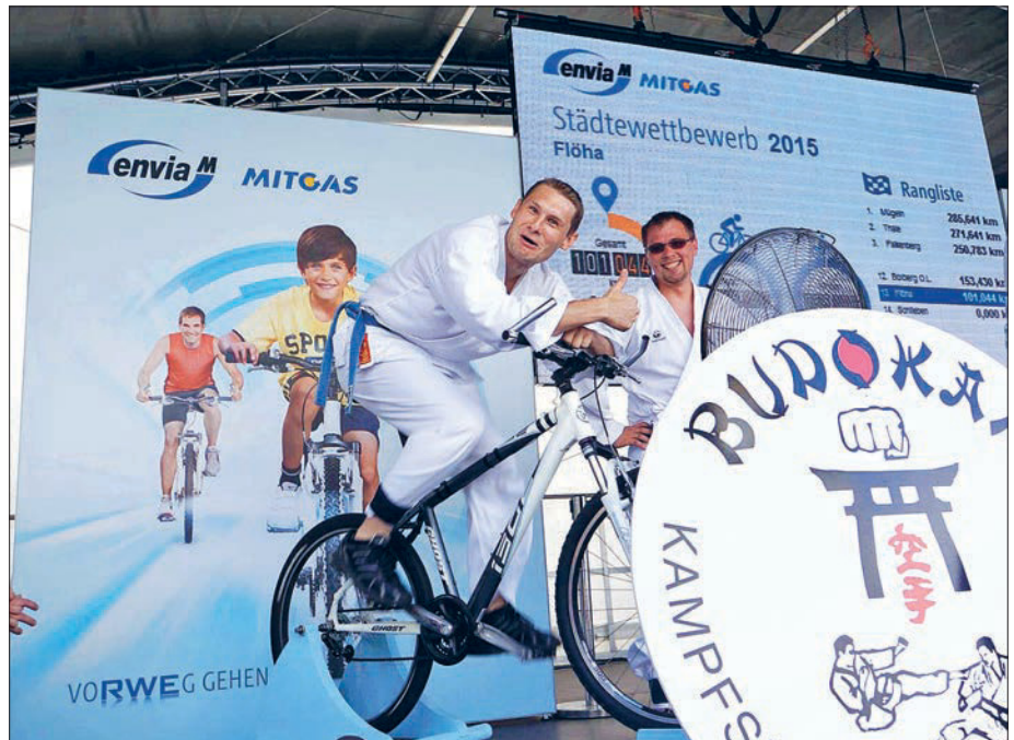
Auch Mitglieder des Budokan Kampfsportvereines Flöha e.V. erradelten zum Städtewettbewerb viele Kilometer für die Stadt Flöha.

In diesem Jahr stehen die folgenden drei Vereine mit ihren Projekten zur Auswahl: