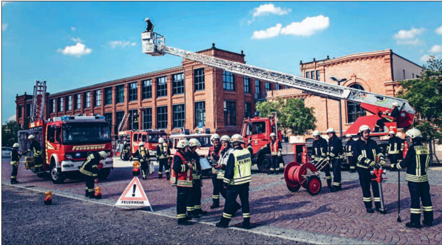
Die Freiwillige Feuerwehr Flöha stellt Teile ihrer modernen Technik auf dem Gelände der Alten Baumwolle zur Schau.

Die Flöhaer Wehr feiert vom 5. bis 8. September 2019 im Gelände der Feuerwache Flöha ihr 150 jähriges Jubiläum. Den Termin sollten sich alle Einwohner von Flöha und Umgebung vormerken – es