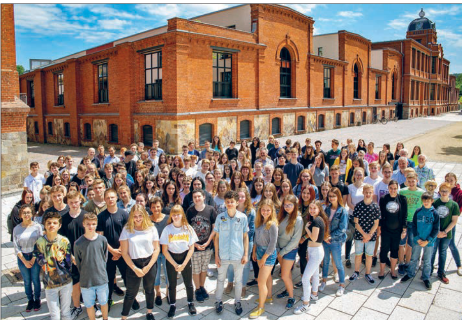
Gruppenfoto der Teilnehmer am Projekt „Architektur macht Schule“ in der Alten Baumwolle.

Am 13. Juni trafen sich rund 180 Schülerinnen und Schüler in der Alten Baumwolle der Stadt Flöha, um ihre Projektergebnisse im Rahmen von „Architektur macht Schule“ der Öffentlichkeit zu präsentieren. Im Schuljahr 2018/19 haben sich insgesamt zehn Schulen aus fünf LEADER-Regionen beteiligt.