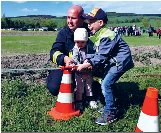
Zielspritzen beim Kinderfest im Ferienhof Falkenau.

Damit eine Freiwillige Feuerwehr funktionstüchtig bleibt und auch in Zukunft zur Stelle ist, wann immer sie gebraucht wird, müssen sich freiwillig Bürgerinnen und Bürger einer Stadt für diese ehrenamtliche Tätigkeit bereiterklären. Sonst wird es in der Tat brenzlig.