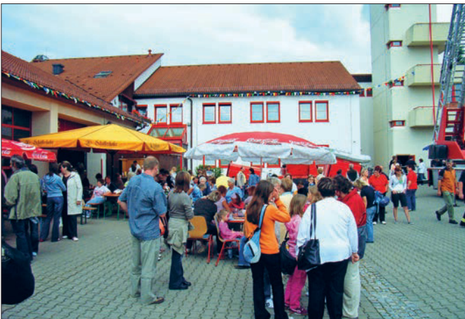
Die Flöhaer Feuerwache verwandelt sich vom 31. August bis zum 2. September wieder in ein Festgelände.