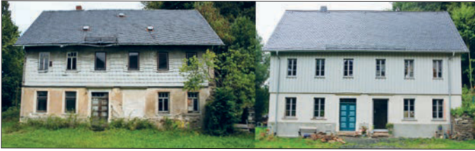
Beispiel für die Sanierung eines denkmalgeschützten Gebäudes als Hauptwohnsitz für eine junge Familie (Bauzeit 2011/12)

In der LEADER-Region „Erzgebirgsregion Flöha- und Zschopautal“ wurden am 05.07.2018 weitere Aufrufe für die Einreichung von Projektvorschlägen im ländlichen Raum gestartet. Grundlage bilden die LEADER-Entwicklungsstrategie und das Budget der Region.