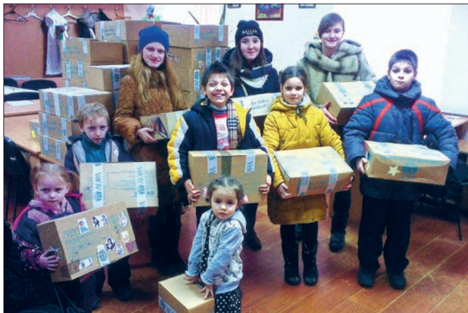
Die Aktion „Kinder helfen Kindern“ beschenkte im vergangenen Jahr auch Kinder in der Ukraine.

Foto: „ADRA Deutschland e. V.“ Aktion Kinder helfen Kindern!“