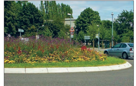
Das Foto zeigt ein Beispiel für die naturnahe Gestaltung einer Verkehrsinsel.

dauernden Stauden und Sträuchern, welche standortheimisch und vom Verband deutscher Wildsamens- und Wildpflanzenproduzenten e. V. zertifiziert sind. Ein Paradies für viele Insekten, ein Augenschmaus für uns Menschen!