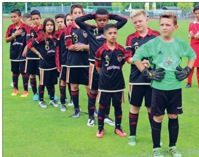
Ein Nachwuchsfußballteam aus Kalifornien/ USA weilte im Sommer im Auenstadion Flöha.

mals Jugendliche aus Amerika Station an der Mündung von Flöha und Zschopau. Ende Juni war ein Fußball-Verein aus Los Angeles (USA) angereist, um an einem kleinen Nachwuchs-Fußballturnier im Auenstadion teilzunehmen. "Immerhin trennen beide Orte auf der Weltkarte rund 9.450 km und 9 Stunden Zeitverschiebung. Doch das stellte kein Hindernis dar", sagte Gunter Pech, der Geschäftsführer des Nachwuchs-Fördervereins. "Die Spieler vom West Coast Elite Football-Club halten ab sofort einen Rekord - nämlich den der am weitesten angereisten Übernachtungsgäste in unserem Hause", erklärte Pech. Im Rahmen eines Schüleraustauschs zeigten sie ihr Können im Auenstadion Flöha und absolvierten gemeinsam mit der E-Jugend des FSV Krumhermersdorf ein Trainingslager. (kbe) □