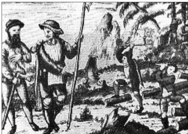
Darstellung Holzmeister und Holzknechte! Holzmeister mit Messlatte und Zackenreißer, sowie die Holzknechte mit der Axt bei der Arbeit. Im Hintergrund ist der Stolleneingang am steilen Berg zu sehen, wobei im Vordergrund der Kahlschlag des Waldes unverkennbar ist.

In dieser Verordnung wird auch geregelt, welcher Waldeigentümer zur Abgabe von