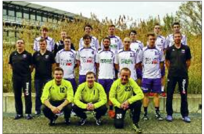
Die Bezirksliga-Handballer des VfB Flöha