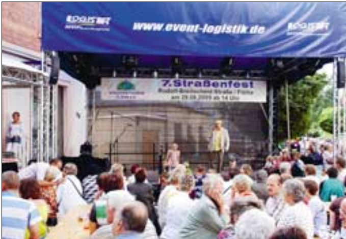
Bühne 7. Straßenfest mit Zwini

Auch in diesem Jahr lädt der Gewerbe- & Festverein Flöha e.V. am 28. August ab 14.00 Uhr nun schon zum 8. Straßenfest in die Rudolf-Breitscheid-Straße in Flöha ein. Der Verein, der das Fest aus eigenen Mitteln und Sponsorengeldern finanziert, hat dieses Jahr ein besonders ansprechendes Bühnenprogramm mit den Kindern des Spielhauses Groß und Klein, Grundschulern der Schillerschule, Schülern der Mittelschule Plaua und der Tanzgruppe „Crazy Cherries“ vorbereitet. Natürlich gibt es wieder die beliebte Modenschau mit dem Modehaus Exklusiv, Voilá – Ihr Wäscheladen und Juwelier-Bauer. Auf dem Veranstaltungsgelände werden sich wieder viele Vereine, Firmen & Privatpersonen präsentieren und somit zu einem abwechslungsreichen Nachmittag beitragen.